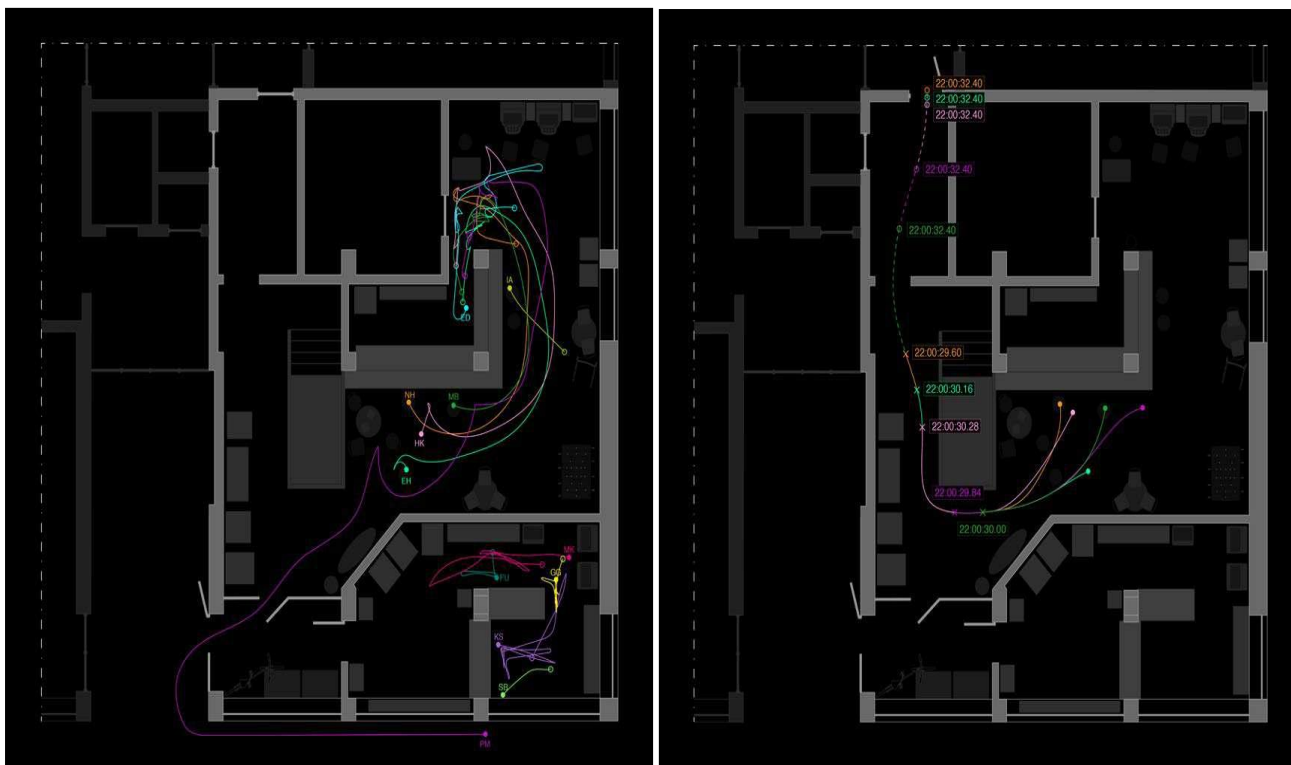
Рисунок 1. Реконструкция перемещения каждой жертвы нападения (слева – реальное, справа - гипотетическое).

выход и знали бы, что он был открыт. На начальном этапе, чтобы провести реконструкцию траектории движения каждого человека, они создали план здания. Далее, синхронизировали реальное время и время на камерах наблюдения внутри здания, а также их поле видимости. После, отследили реальную траекторию и время перемещения всех лиц, т.е. восстановили точную хронологию события. Затем, перенесли эти данные на пять гипотетических путей от стартовых позиций каждой жертвы к аварийному выходу с учетом возможных препятствий и погрешности измерения.