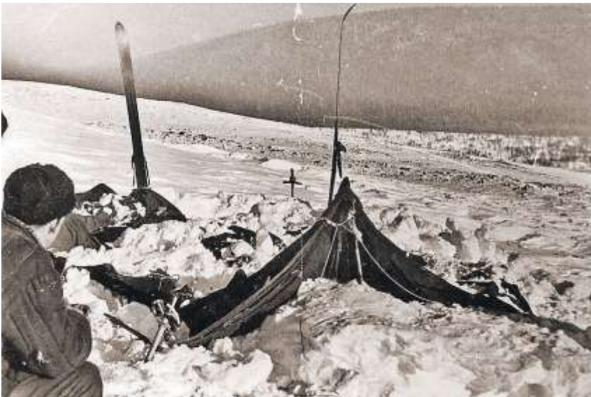
Одна из главных нестыковок лавинной версии – почему палатку туристов полностью не придавило снегом?